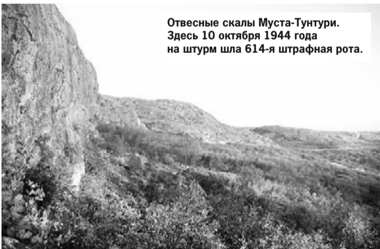
Отвесные скалы Муста-Тунтури. Здесь 10 октября 1944 года на штурм шла 614-я штрафная рота.

ским артиллеристам и летчикам также не удалось блокировать порт Лиинахамари, куда доставлялись грузы немцам.