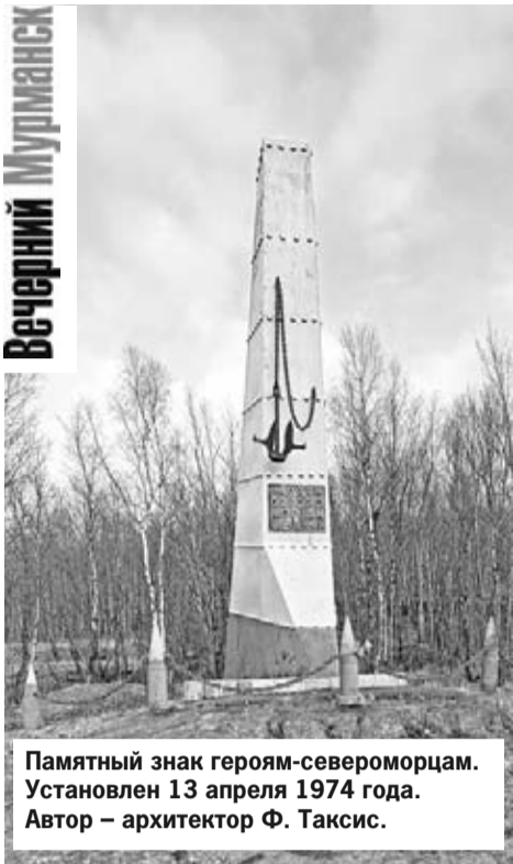
Памятный знак героям-североморцам. Установлен 13 апреля 1974 года. Автор – архитектор Ф. Таксис.