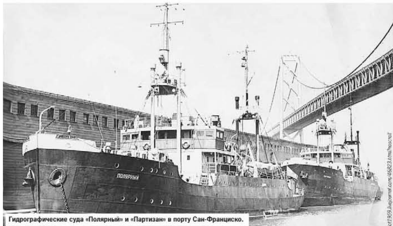
Гидрографические суда «Полярный» и «Партизан» в порту Сан-Франциско.