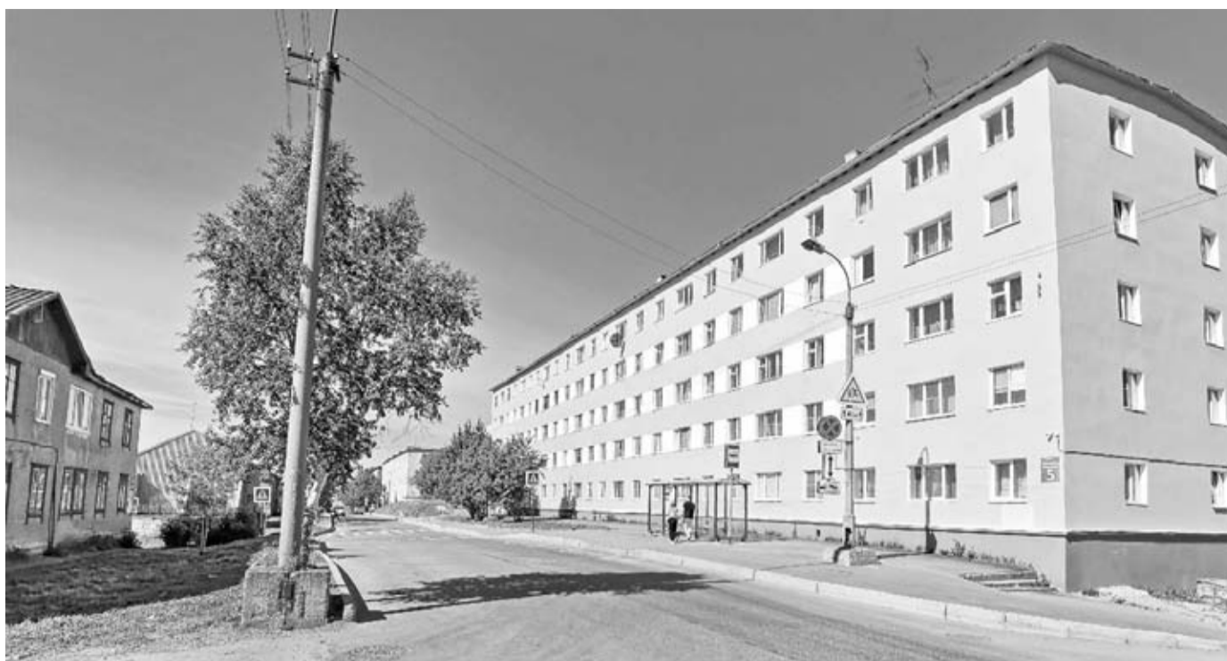
Улица Генерала Фролова