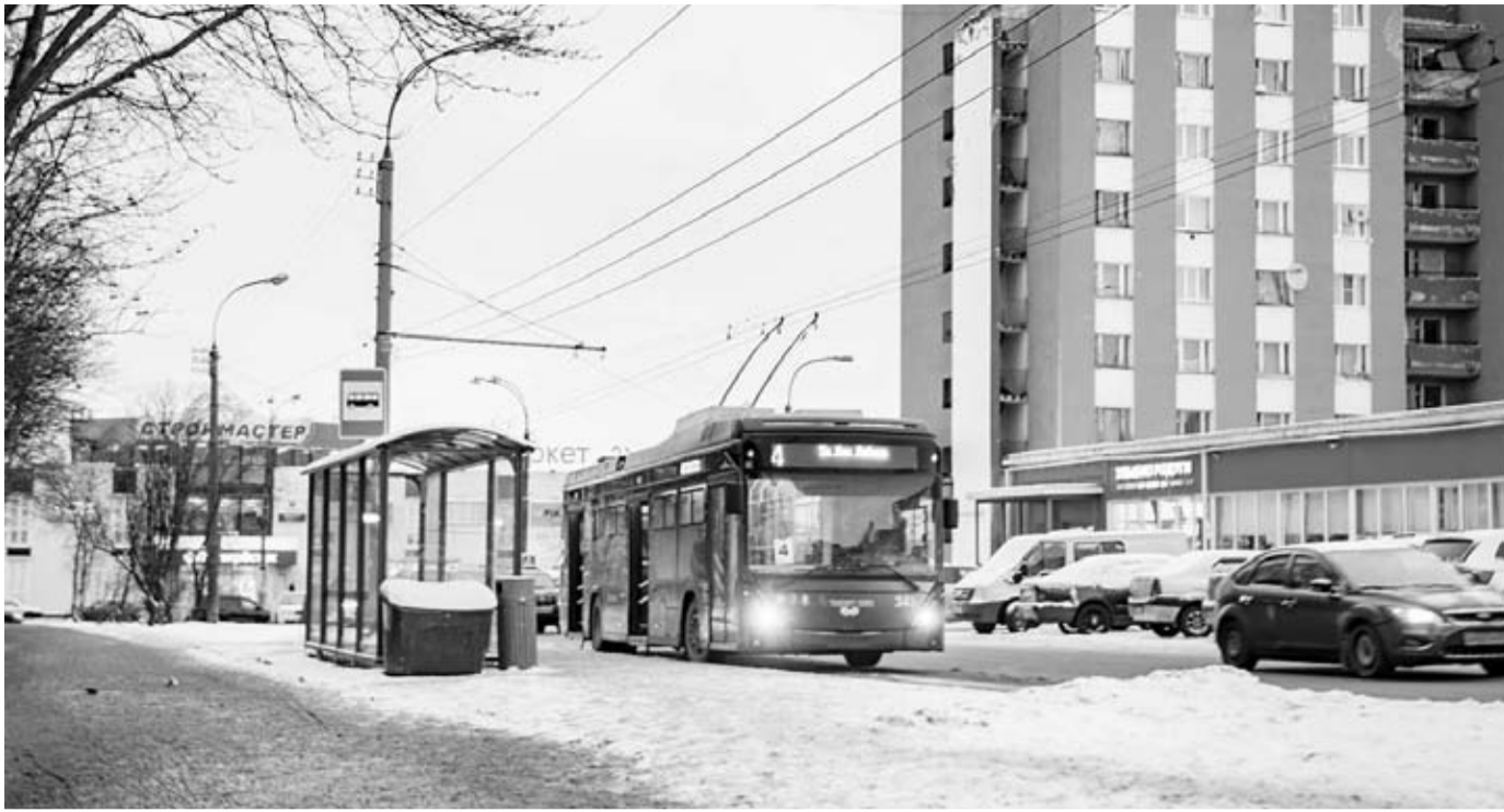
Улица Генерала Щербакова