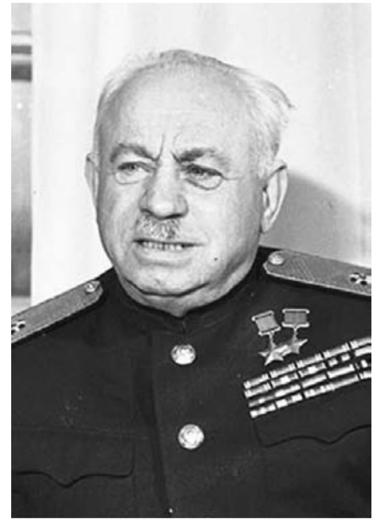
Иван Дмитриевич ПАПАНИН