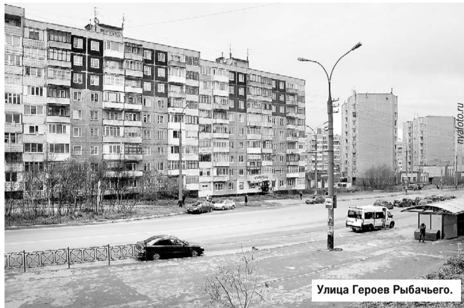
Улица Героев Рыбачьего.

что в 1939 году главным противником СССР считалась не гитлеровская Германия, а Великобритания. Владычице морей, обладающей мощным ВМФ, было проще всего подойти к Среднему и Рыбачьему именно с моря.