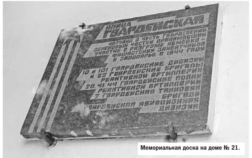
Мемориальная доска на доме № 21.

Главная особенность улицы – наличие на ней сразу двух мемориальных досок, посвященных одному событию. Доска на доме № 3 сообщает, что улица «названа в честь