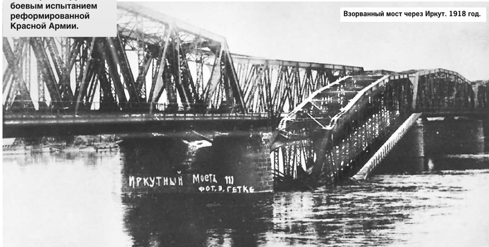
Взорванный мост через Иркут. 1918 год.

Андрей КИРОШКО. Использованы материалы Государственного архива Мурманской области, Мурманского областного краеведческого музея.