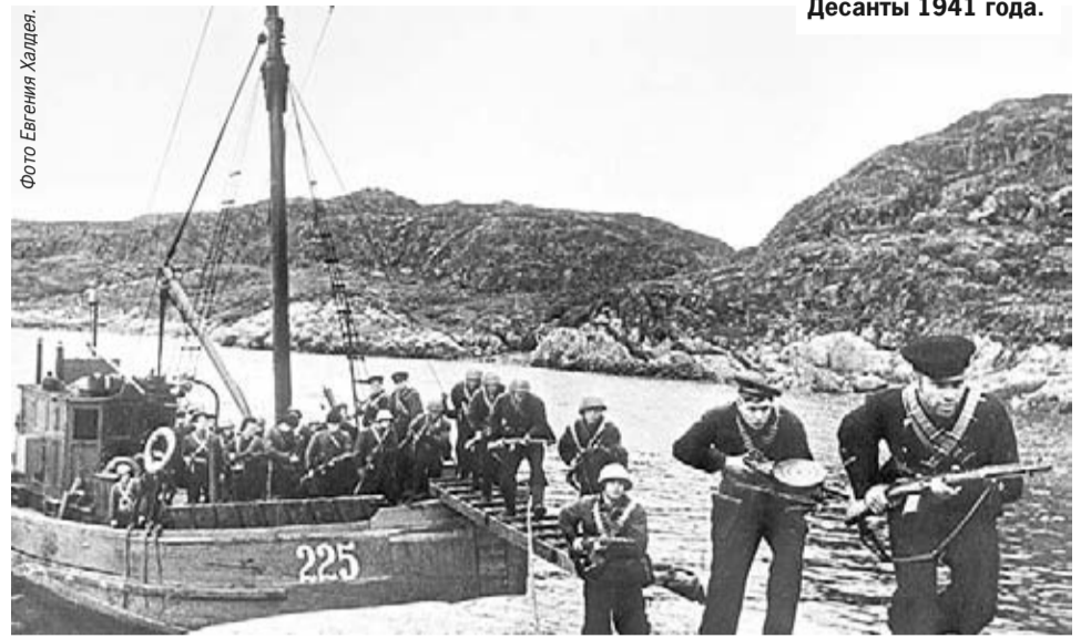
Десанты 1941 года.

В 1941 году корабли Северного флота совершили 63 выхода для стрельбы по береговым целям и израсходовали 7 344 снаряда калибра 102–130 мм. Из эскадренных миноносцев чаще всего такую задачу вы-