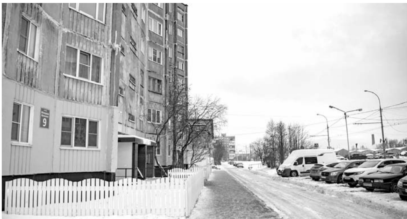
Проезд Михаила Ивченко