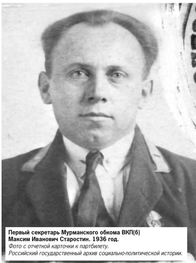
Первый секретарь Мурманского обкома ВКП(б) Максим Иванович Старостин. 1936 год. Фото с отчетной карточки к партбилету. Российский государственный архив социально-политической истории.

Получается, что из своих 16 лет юный Максим восемь отдал учебе. Это совершенно необычно для представителя того социального слоя, к которому он относился. В лучшем случае сверстники Мак-