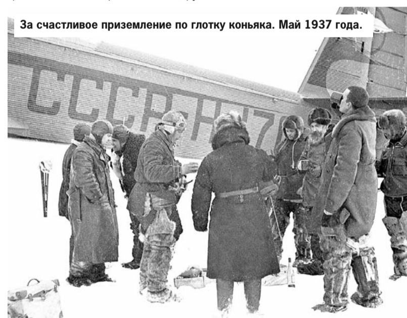
За счастливое приземление по глотку коньяка. Май 1937 года.

Уже тогда Папанину везло на встречи с удивительными людьми. Он общался с Фрунзе , а воевать ему пришлось бок о бок с будущим драматургом Всеволодом Вишневским и кинорежиссером Марком Донским . Работая в ЧК, Папанин знакомится с уже известным к тому времени писателем Константином Треневым и совсем юным Игорем Курчатовым . Будущий создатель советской атомной бомбы пришел к нему просить за своих арестованных друзей.