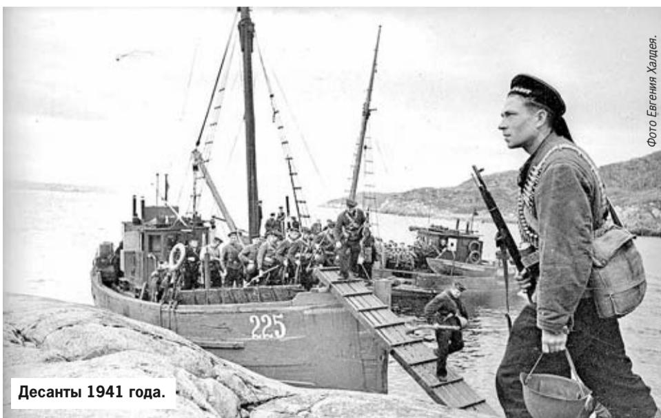
Десанты 1941 года.

Повторить успех десантов 1941 года советская сторона попыталась в ходе апрельско-майского наступления 1942-го. Это была самая крупная высадка на вражеский берег – более 6000 бойцов 12-й бригады морской пехоты. Но, увы, достичь поставленных целей десантники не смогли.