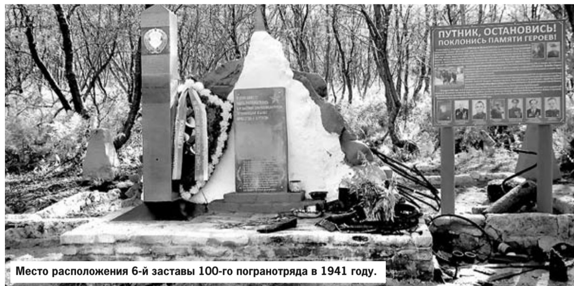
Место расположения 6-й заставы 100-го погранотряда в 1941 году.