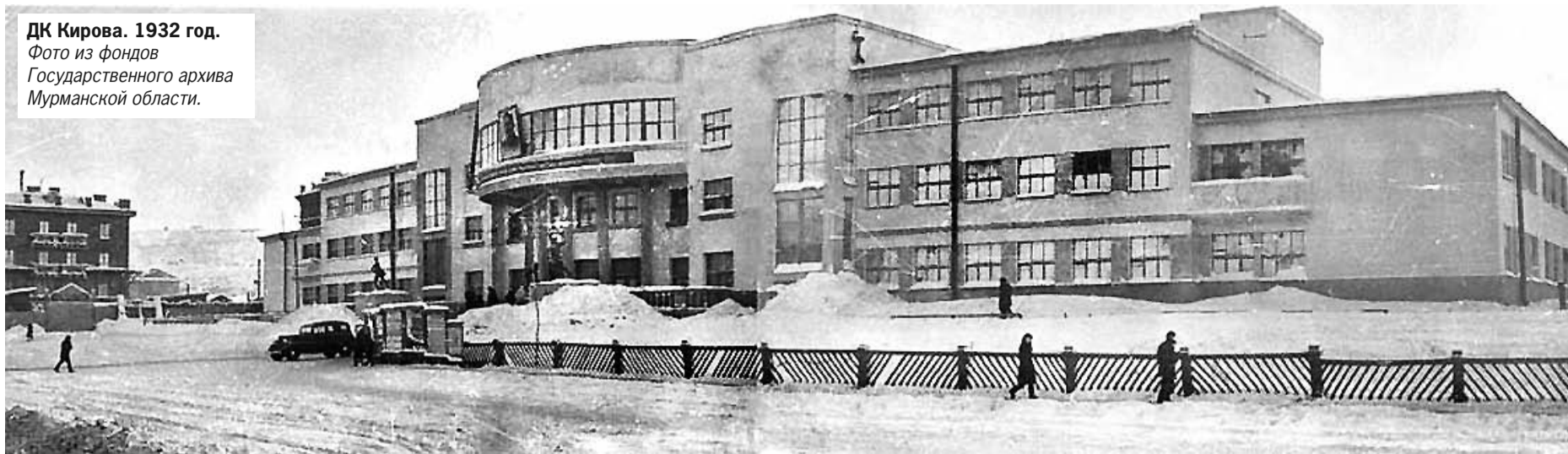
ДК Кирова. 1932 год.