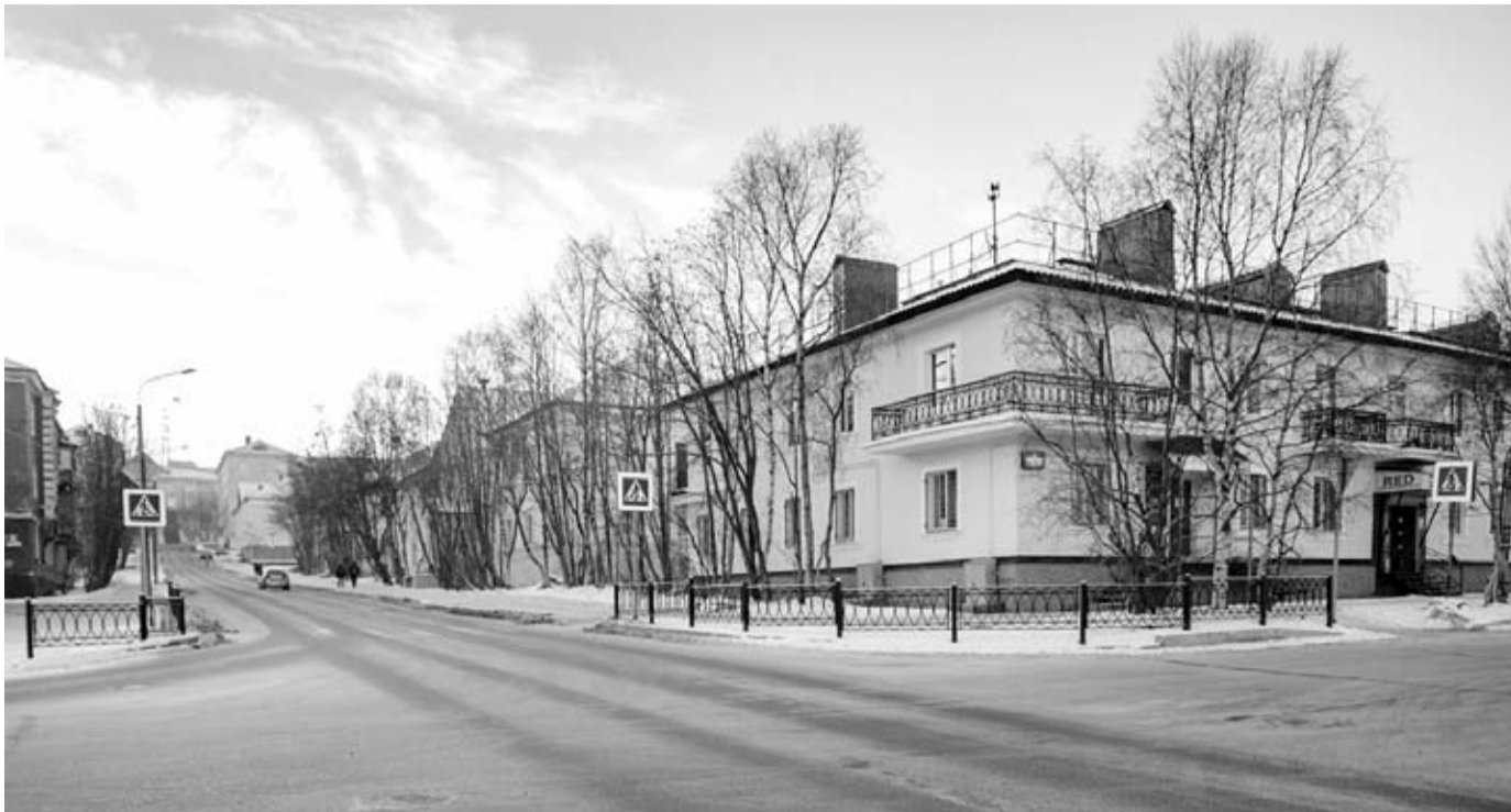
Улица Алексея Генералова