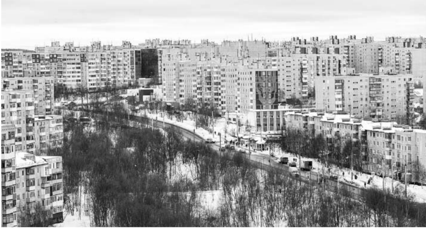
Улица Героев Рыбачьего