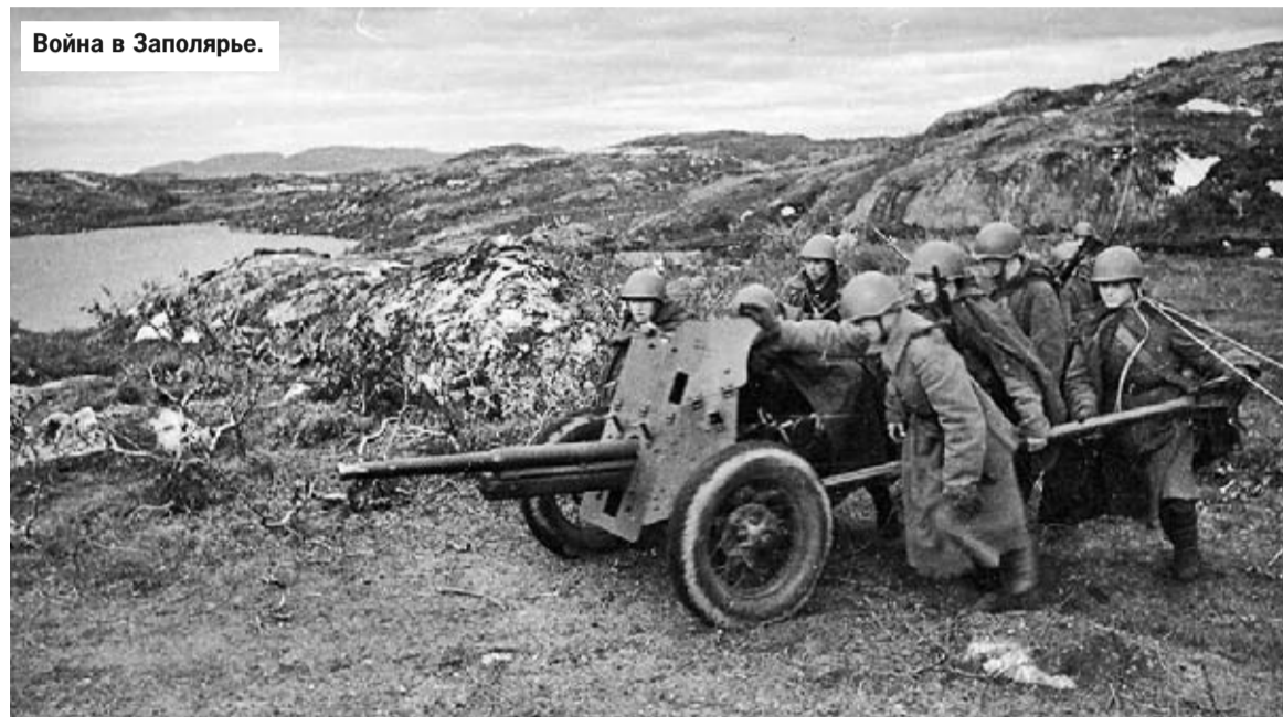
Война в Заполярье.