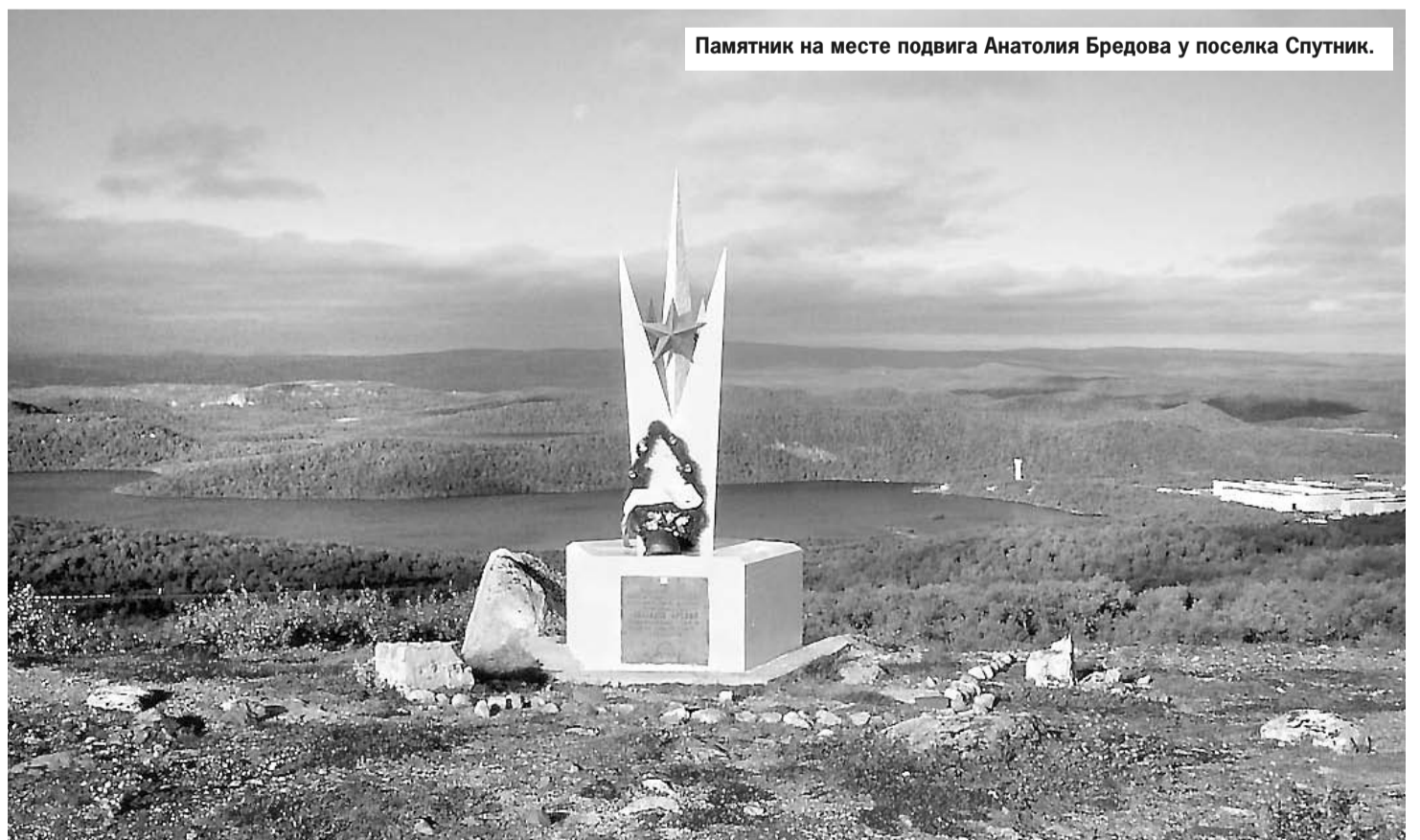
Памятник на месте подвига Анатолия Бредова у поселка Спутник.

Андрей КИРОШКО. Использованы материалы Государственного архива Мурманской области, Мурманской областной научной универсальной библиотеки.