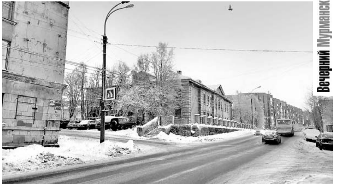
Улица Сафонова в Мурманске.

Еще до рокового полета 30 мая 1942 года на подполковника Сафонова было написано представление на вторую Золотую Звезду. Знал ли об этом Борис Феоктистович, нам неизвестно. Указ о присвоении ему звания Героя Советского Союза вышел 16 июня 1942 года.