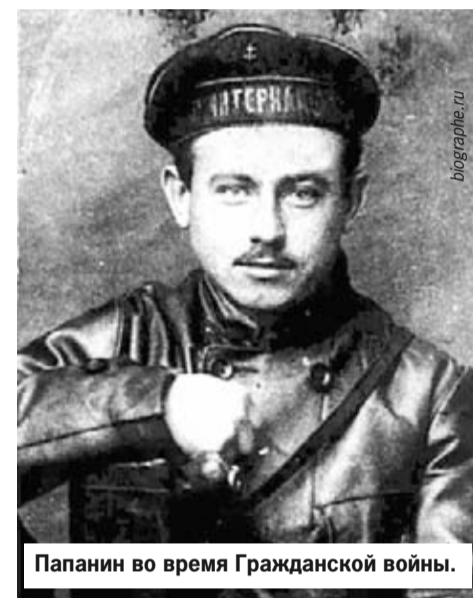
Папанин во время Гражданской войны.

Север только осваивался. Помимо узких специалистов здесь требовались организаторы и руководители на местах. Уже в 1932 году Папанина назначают начальником станции «Бухта Тихая» (Земля Франца-Иосифа). Здесь Ивану Дмитриевичу пришлось делать то же, что и в Томмоте – строить. Успешно выполнив эту задачу, он практически без перерыва отправляется на мыс Челюскин (полуостров Таймыр), самую северную точку Евразии, где опять строит станцию. Точнее, расширяет уже имеющуюся.