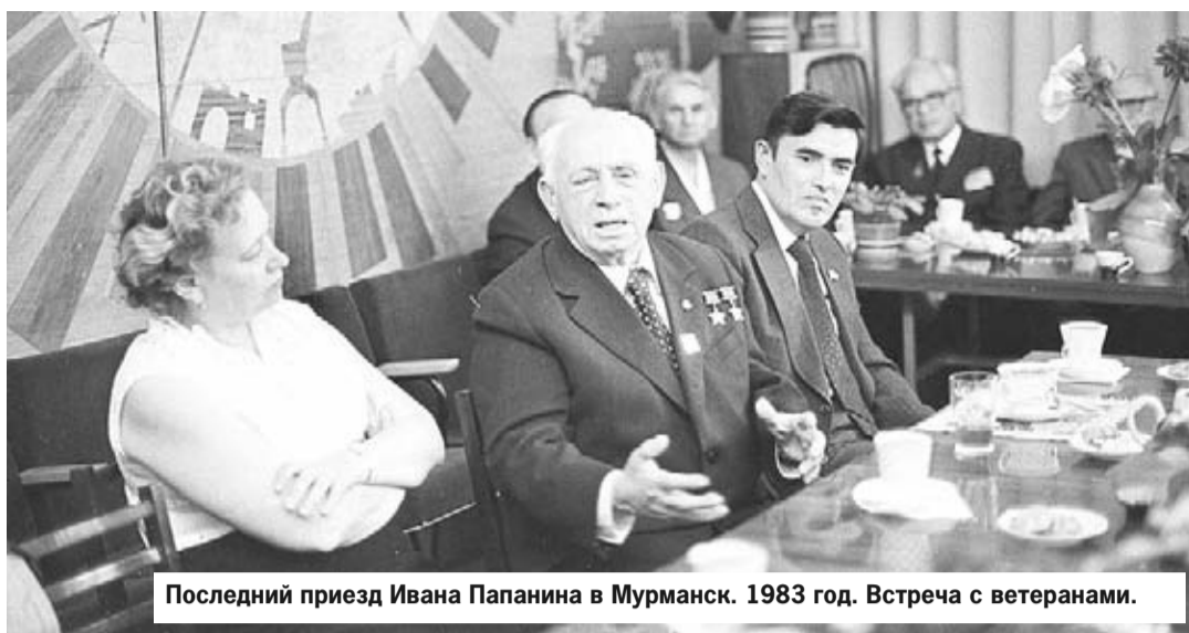
Последний приезд Ивана Папанина в Мурманск. 1983 год. Встреча с ветеранами.