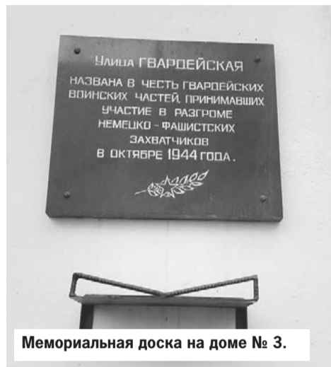
Мемориальная доска на доме № 3.

Чтобы получить гвардейское звание, военной части надо было отличиться на поле боя. Но некоторым подразделениям оно присваивалось в момент формирования. В частности, это касалось частей «катуш», воздушно-десантных войск и подразделений минеров. Тем самым подчеркивалась их особая роль при проведении боевых операций.