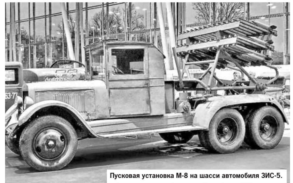
Пусковая установка М-8 на шасси автомобиля ЗИС-5.