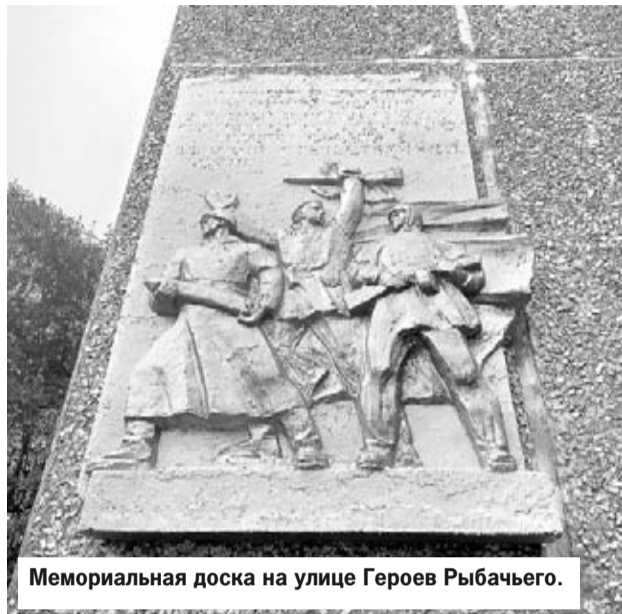
Мемориальная доска на улице Героев Рыбачьего.