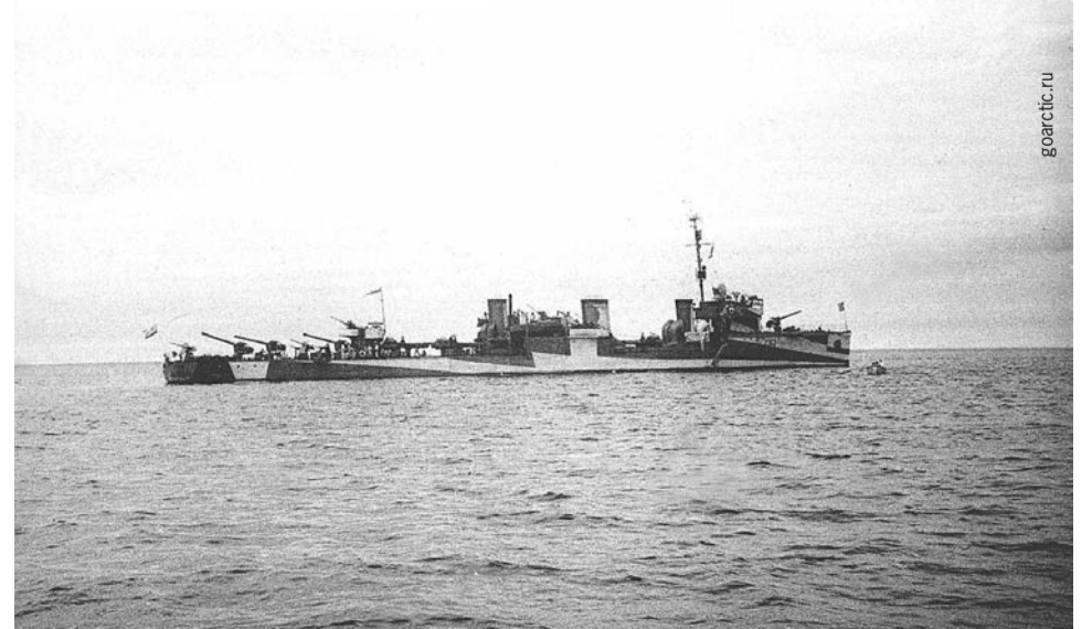
Эсминец СФ «Валериан Куйбышев».

Андрей КИРОШКО.