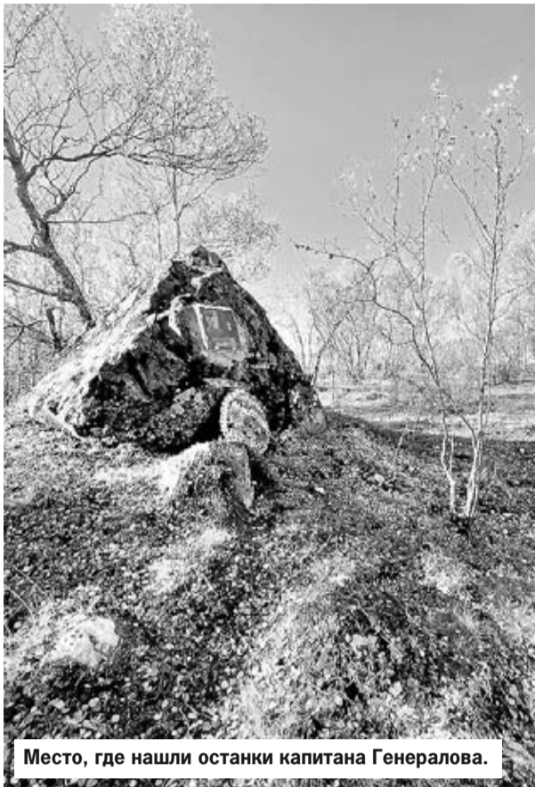
Место, где нашли останки капитана Генералова.