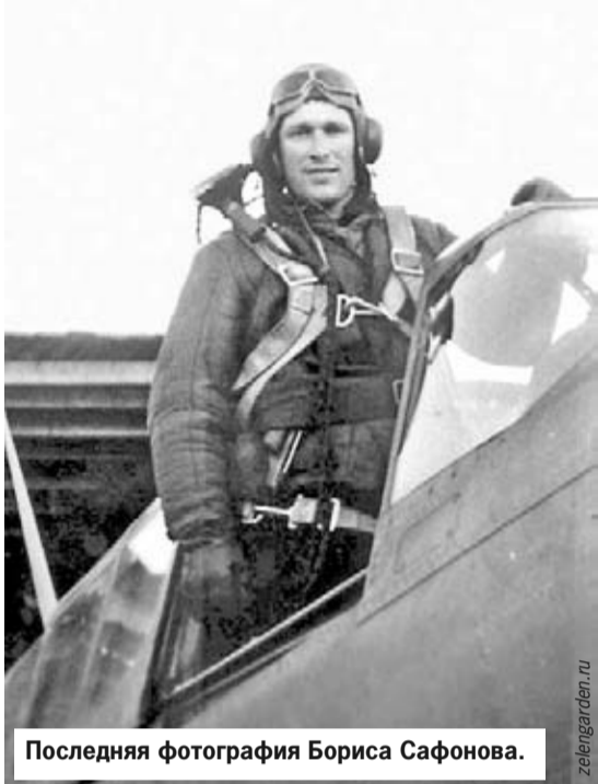
Последняя фотография Бориса Сафонова.