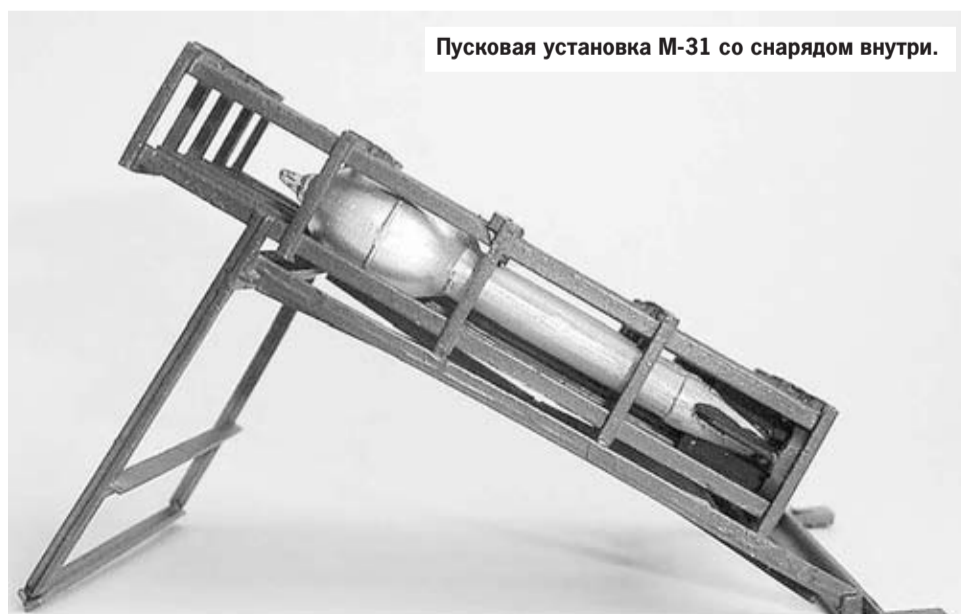
Пусковая установка М-31 со снарядом внутри.

Деятельность гвардейских батальонов минеров стала широко освещаться только в последние годы. Все дело в том, что именно на опыте этих подразделений был впоследствии сформирован спецназ ГРУ. Только в 2015 году были опубликованы официальные отчеты о диверсионной работе за 1944 год. В сентябре 1942 года было создано 15 отдельных гвардейских батальонов минеров, по одному на каждый фронт «для минирования и разрушения коммуникаций и важных объектов в тылу противника». Их наиболее активное применение приходится на вторую половину 1942-го – первую половину 1943