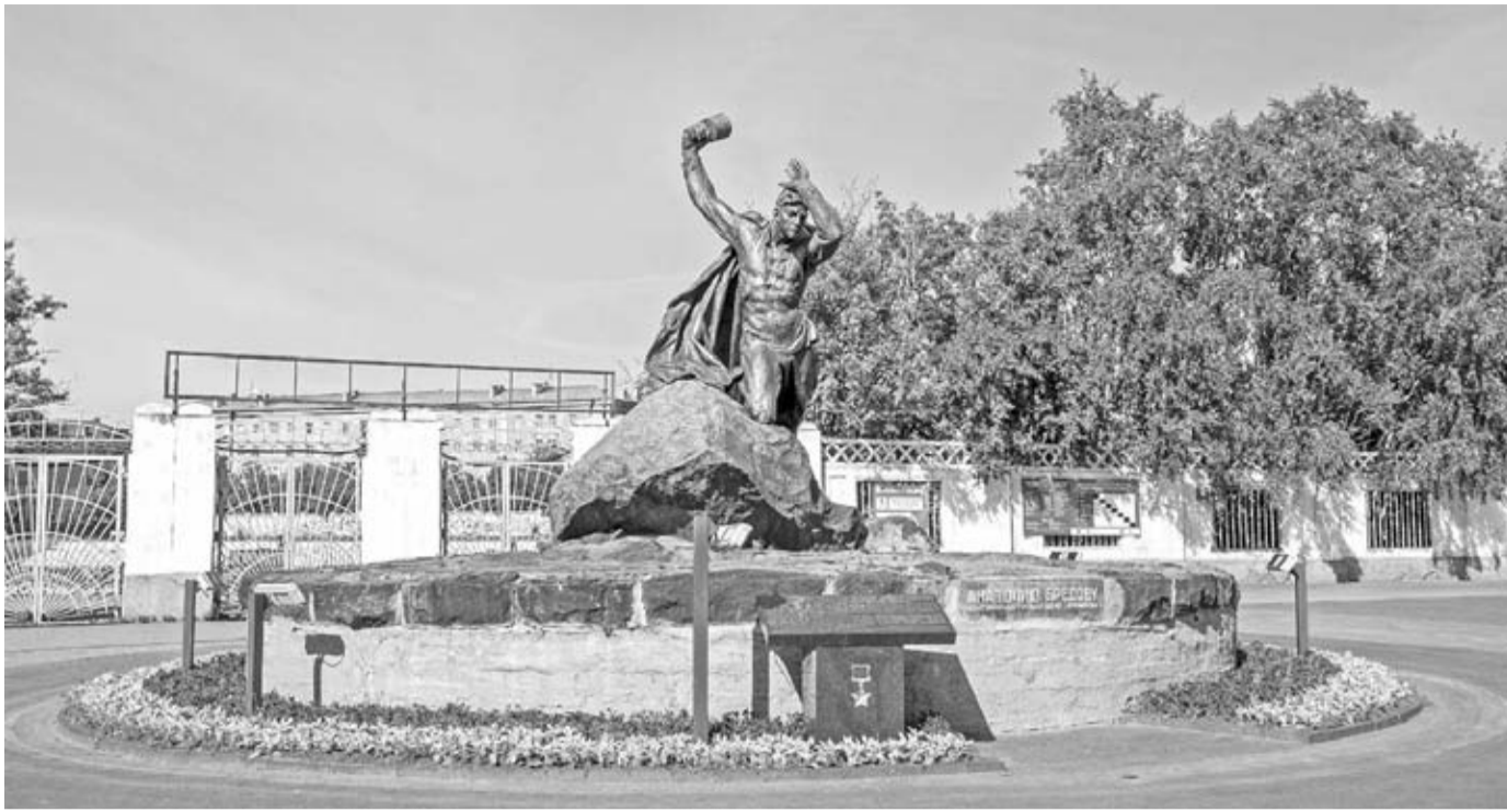
Памятник Анатолию Бредову в центре Мурманска