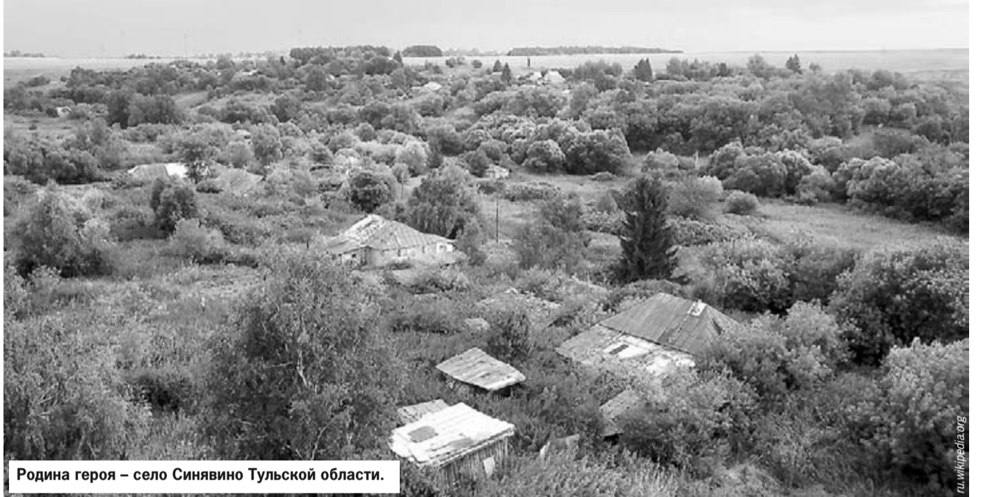
Родина героя – село Синяино Тульской области.

О дважды Герое Советского Союза Борисе Феоктистовиче Сафонове знает, наверное, каждый житель нашей страны. Но у нас на Севере к нему особое внимание. Ведь именно в небе Заполярья воевал и погиб этот легендарный ас, первым в СССР получивший во время Великой Отечественной войны две Золотые Звезды.