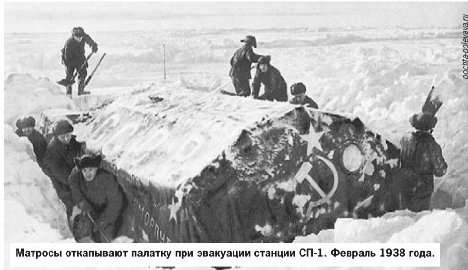
Матросы откапывают палатку при эвакуации станции СП-1. Февраль 1938 года.

Фото из фондов Мурманского областного краеведческого музея и открытых Интернет-источников. Использованы материалы Государственного архива Мурманской области.