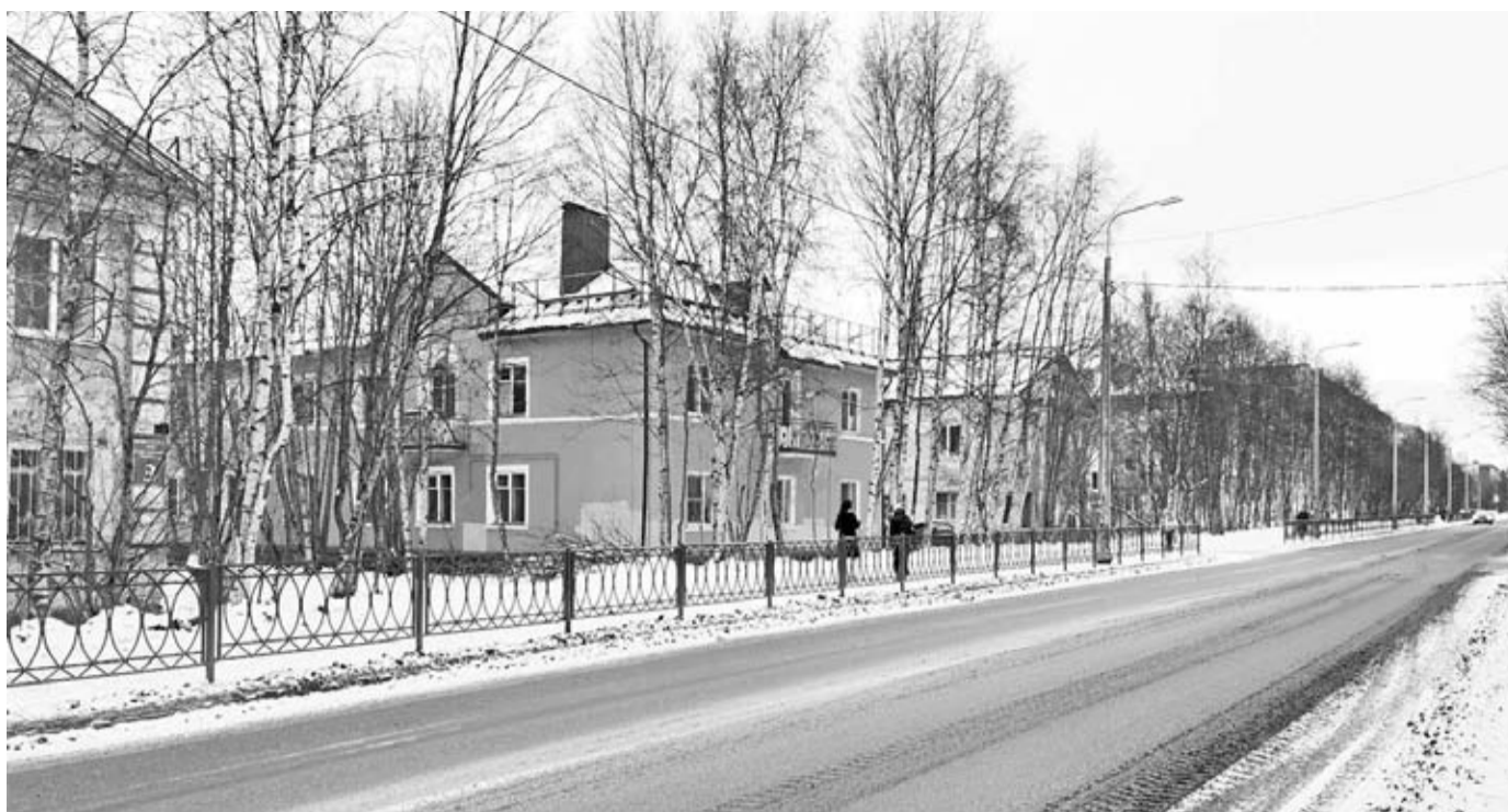
Улица Вице-адмирала Николаева