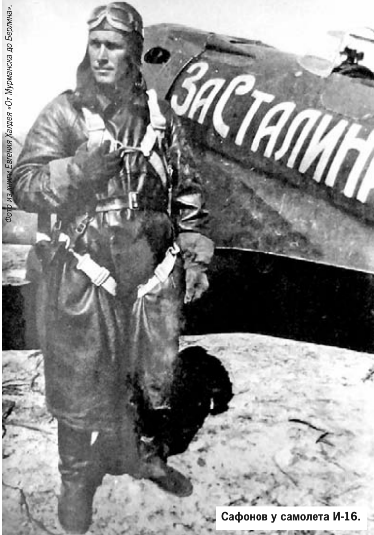
Сафонов у самолета И-16.

К концу августа 1941 года на счету Сафонова было уже 11 сбитых фрицев. Это дало командованию возможность представить его к званию Героя Советского Союза. В ту пору награждали редко: командиры искренне считали, что бойцы просто выполняют свою работу, и это не повод для вручения им ордена или медали. Но кандидатура Сафонова возражений не вызвала. 16 сентября 1941 года вышел указ Верховного Совета СССР о присвоении командиру эскадрильи Сафонову высокого звания Героя Советского Союза. В октябре 1941 года майор Сафонов начал командовать вновь сформированным 78-м истребительным авиаполком, оснащенным британскими самолетами.