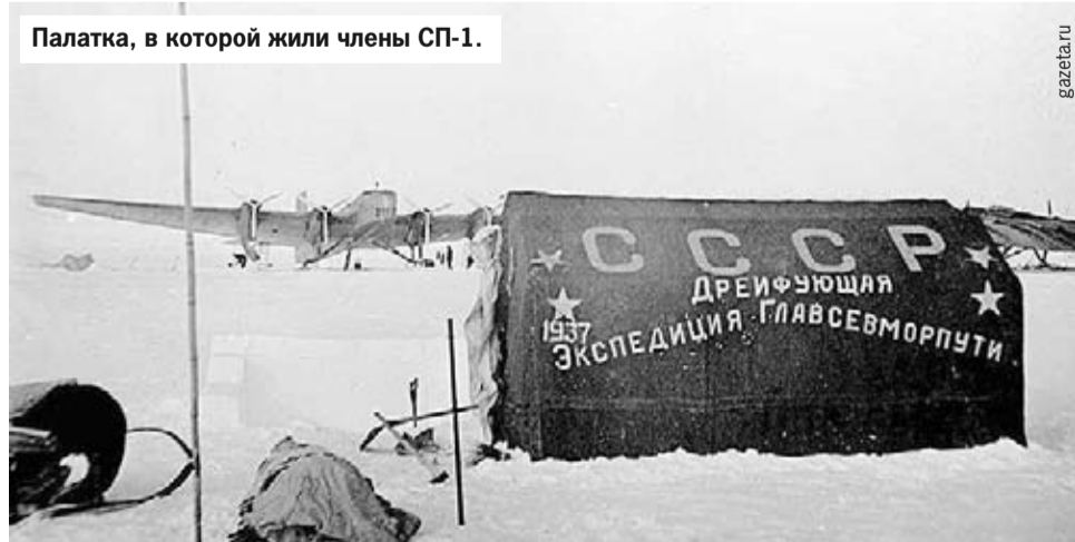
Палатка, в которой жили члены СП-1.

Дважды Герой Советского Союза, кавалер девяти орденов Ленина, двух орденов Красного Знамени и двух орденов Трудового Красного Знамени (было еще множество других, в том числе иностранных), по-