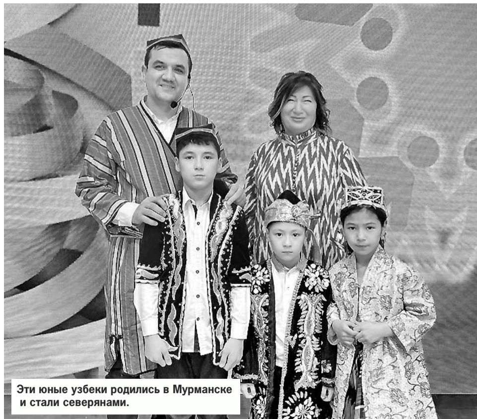
Эти юные узбеки родились в Мурманске и стали северянами.