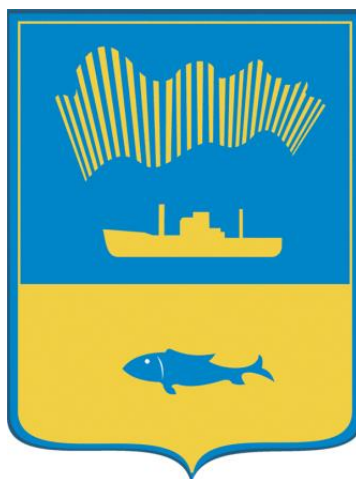
Схема теплоснабжения муниципального образования городской округ город-герой Мурманск на период с 2023 по 2042 годы